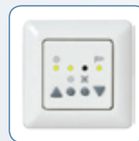
Wiso Control 50