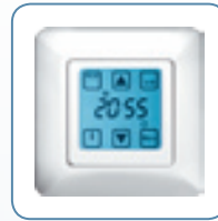
Quattro S 50

* im Vergleich zu handelsüblichen Schaltuhren mit Transformator